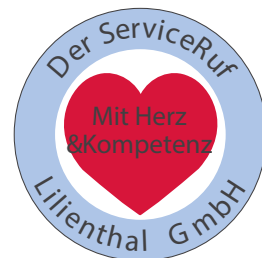
Damaliges Pflegedienst Logo