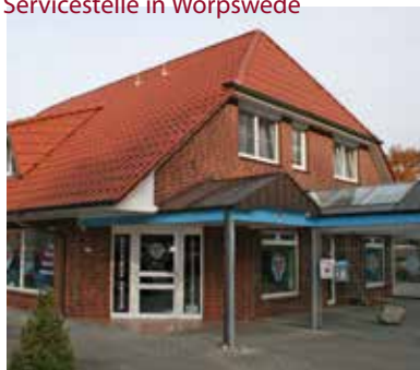
Servicestelle in Worpswede