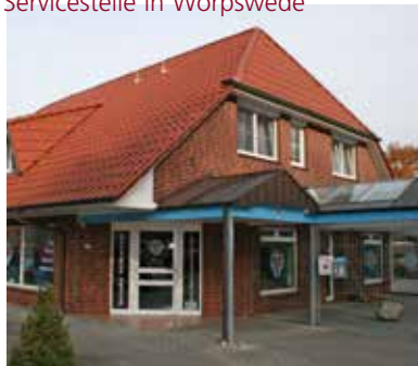
Servicestelle in Worpswede