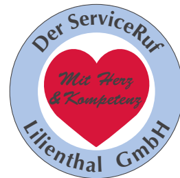
Damaliges Pflegedienst Logo